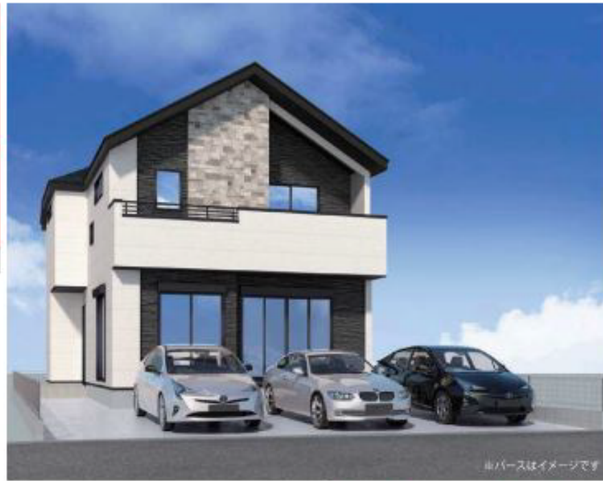
※パースはイメージです