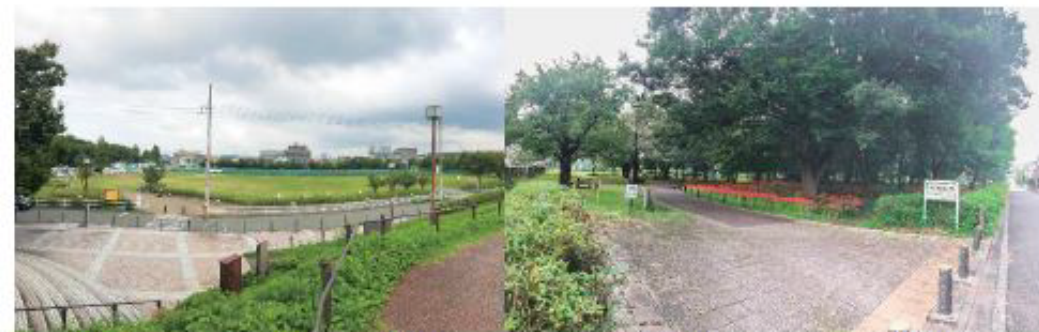
浅川スポーツ公園 (本物件より約150m)