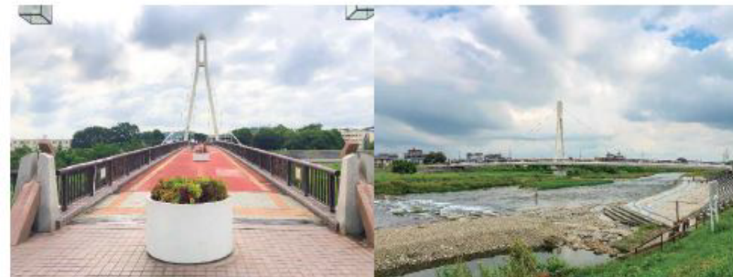
ふれあい橋 (本物件より約100m)