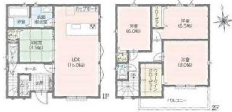
建築確認番号:第2023SBC-第02776H号