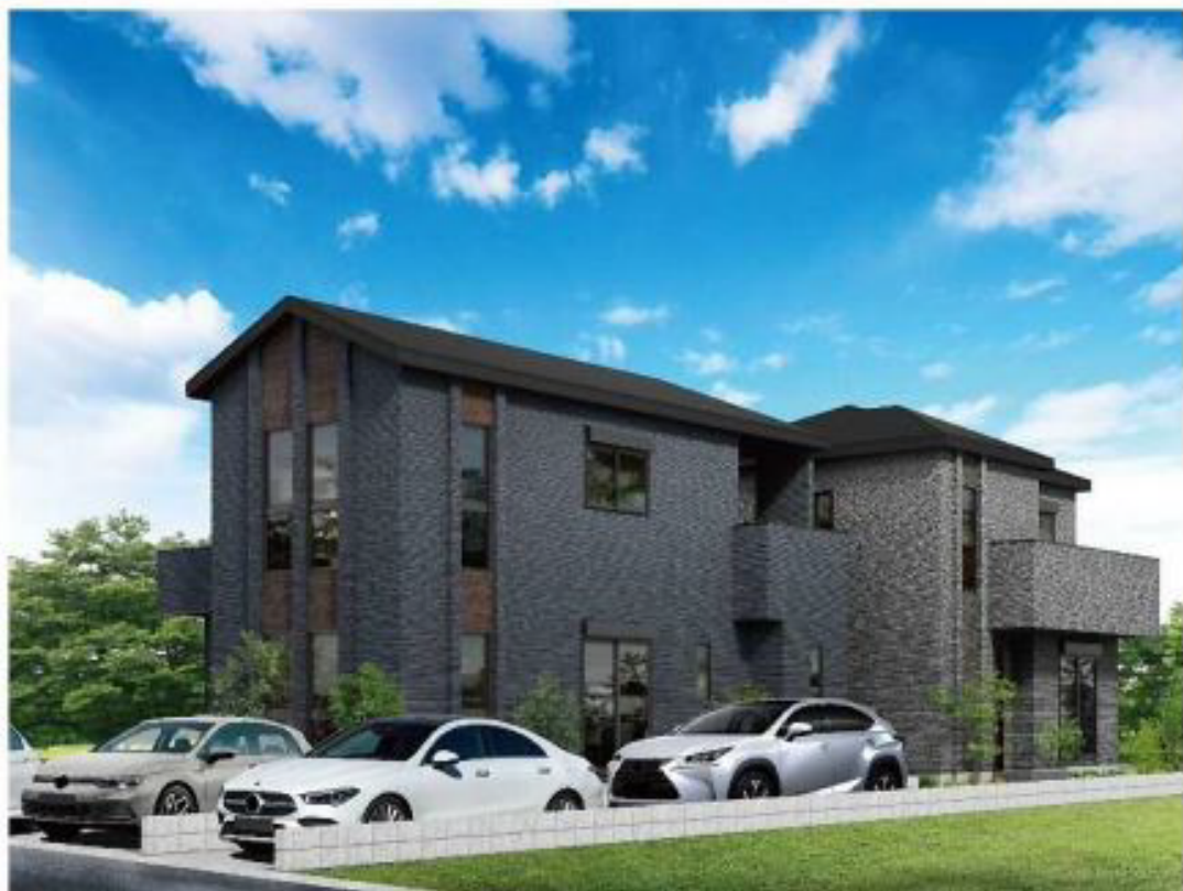
※外観画像はイメージです。