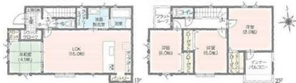
建築確認番号:第2023SBC-第02775H号