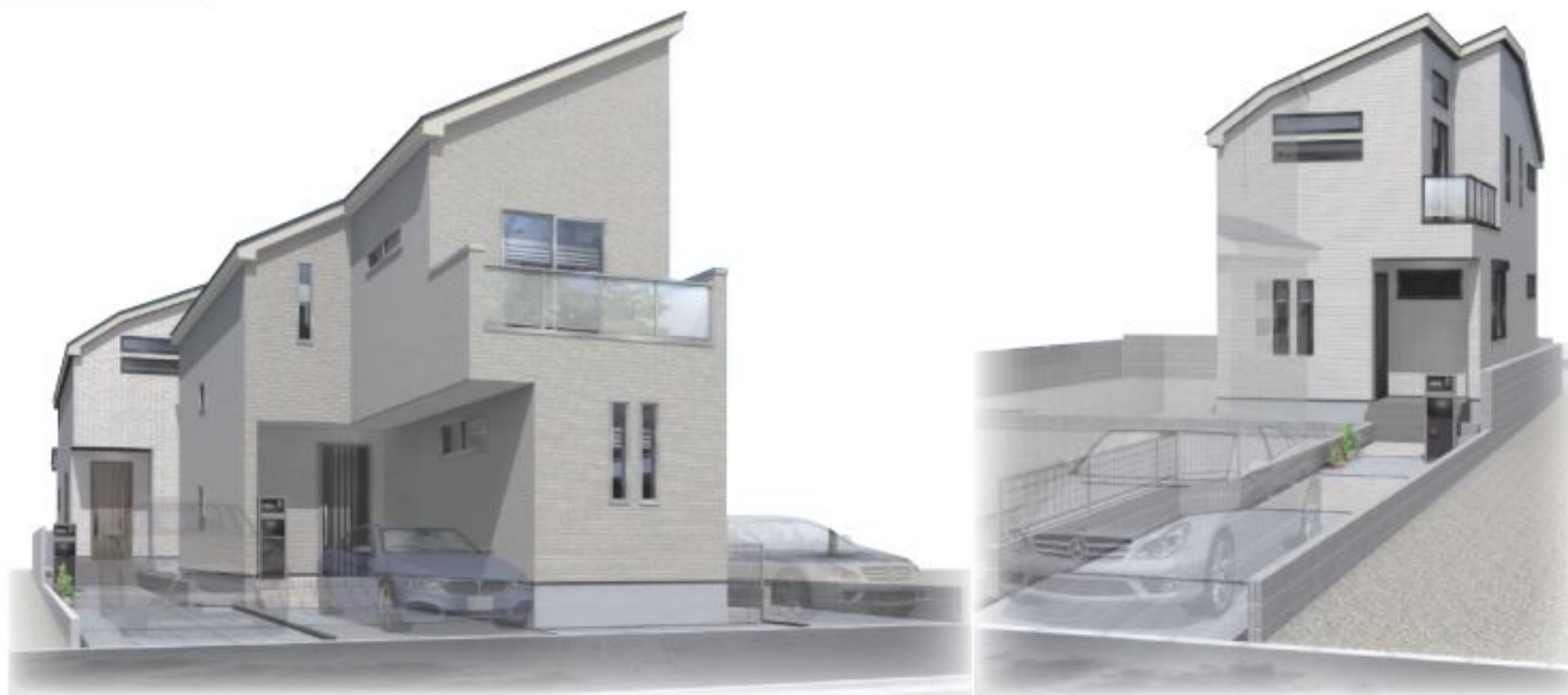
※掲載の完成予想図は図面を基に描いたものであり実際とは多少異なります。