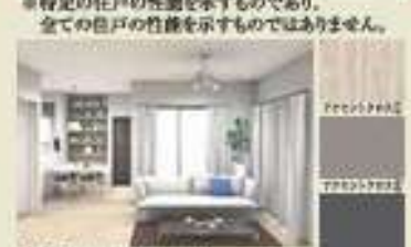
内装イメージ(スマート) ※イメージです。状況と異なる場合は販売を優先させていただきます。また、買取りも本物件とは異なります。