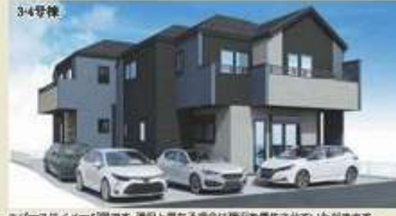
※イメージです。状況と異なる場合は販売を優先させていただきます。